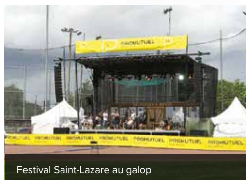
Festival Saint-Lazare au galop