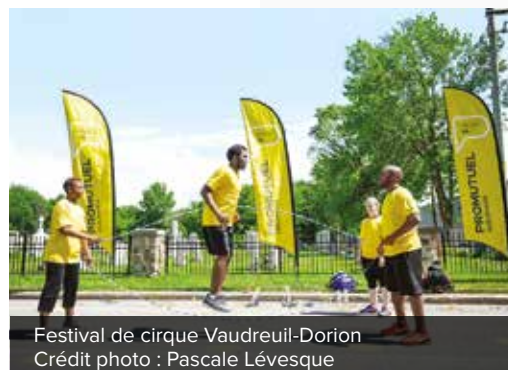
Festival de cirque Vaudreuil-Dorion

Enfin, merci à vous, chers membres-assurés, d'être de plus en plus nombreux chaque année à nous faire confiance. En choisissant Promutuel Assurance, vous investissez dans l'économie locale et, par le fait même, dans les valeurs coopératives qui animent une entreprise mutualiste comme la nôtre. Merci de nous permettre, toujours et plus que jamais, d'être là.