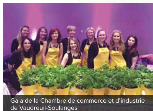
Gala de la Chambre de commerce et d'industrie de Vaudreuil-Soulanges