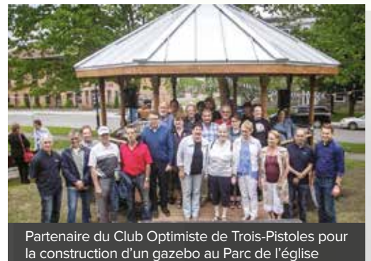
Partenaire du Club Optimiste de Trois-Pistoles pour la construction d'un gazebo au Parc de l'église