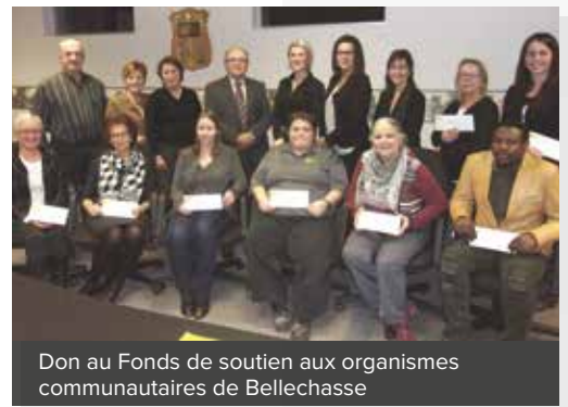
Don au Fonds de soutien aux organismes communautaires de Bellechasse

Enfin, merci à vous, chers membres-assurés, d'être de plus en plus nombreux chaque année à nous faire confiance. En choisissant Promutuel Assurance, vous investissez dans l'économie locale et, par le fait même, dans les valeurs coopératives qui animent une entreprise mutualiste comme la nôtre. Merci de nous permettre, toujours et plus que jamais, d'être là.