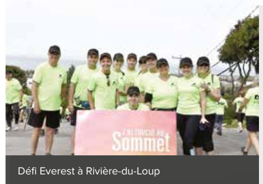
Défi Everest à Rivière-du-Loup