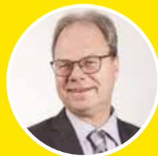
LE PRÉSIDENT, RENÉ GOUPIL