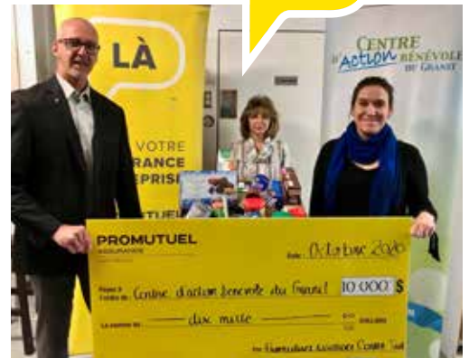
Dons à quatre organismes de la région pour les aider à poursuivre leur mission en services d'aide alimentaire auprès de la population