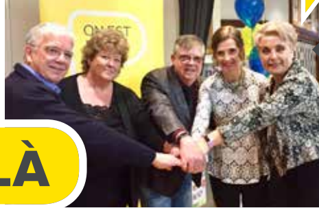
Lancement du Relais pour la vie de Coaticook