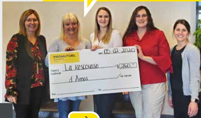
Photos prises avant l'arrivée de la pandémie et l'application des mesures sanitaires