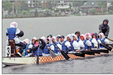
Équipe participante de Promutuel Prairie-Valmont lors du Défi «EnBarque pour ta fondation» du Centre hospitalier de Granby

Au total, en 2013, nous avons rapidement remis 22 855 000 $ en indemnités à nos membres-assurés victimes d'un sinistre, une hausse de 7 % par rapport à 2012. Cette hausse de sinistres est principalement attribuable aux conditions climatiques défavorables qui ont marqué 2013.